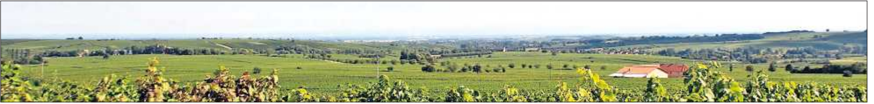
Idyllische Landschaft: Die Aussichten entlang der Strecke, wie hier bei Leinsweiler, entschädigen für manche zu überwindende Höhenmeter.